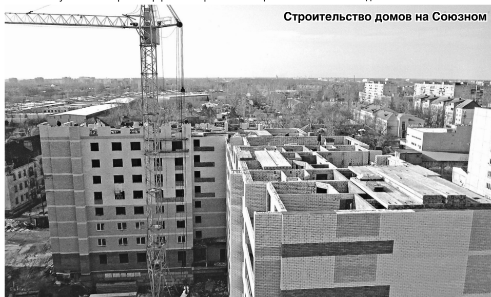
Строительство домов на Союзном

Дома в основном были двухэтажные, восьмиквартирные и строились из разных материалов: фундамент – бутовый, стены из шлакоблоков, красного и силикатного кирпича, с деревянными перекрытиями и лестничными пролётами. Строительство велось без применения грузоподъёмных механизмов, с использованием носилок, тачек. Дома были без удобств, отапливались печами на угле. Таких домов было построено более 150, и около 30 домов трёхэтажных. В период с 1956 по 1960 год вырос посёлок, которому дали имя Народный;