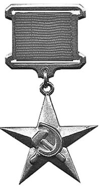
Звезда Героя Социалистического труда