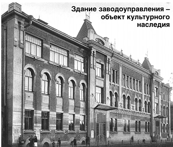
Здание заводоуправления – объект культурного наследия

В этом официальном документе специально оговаривается, что «все прочие объекты недвижимости, расположенные на данной территории не относятся к объектам культурного наследия». Это судокорпусный цех №2 (1894), механосборочный цех №6 (1906), модельный цех (1900), здание мастерских (1904), чугунолитейный цех (1895, сегодня разобран), а также здание