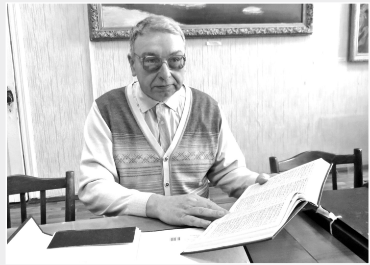
Материалы подготовила Маргарита ФИНЮКОВА

Родился в 1958 году, в Сормове. После окончания политехнического института работал в ЦНИИ «Буревестник». В 1984 году был призван в армию, отслужил 24 года – в артиллерийских войсках, а с 1996 по 2009 год – в военном комиссариате Сормовского района, помощником начальника отделения. В его обязанности входила работа с участниками Великой Отечественной войны, локальных войн и военных конфликтов. В 2009 году уволился из Вооружённых Сил по возрасту и проработал в военкомате гражданским специалистом до 2017 года.