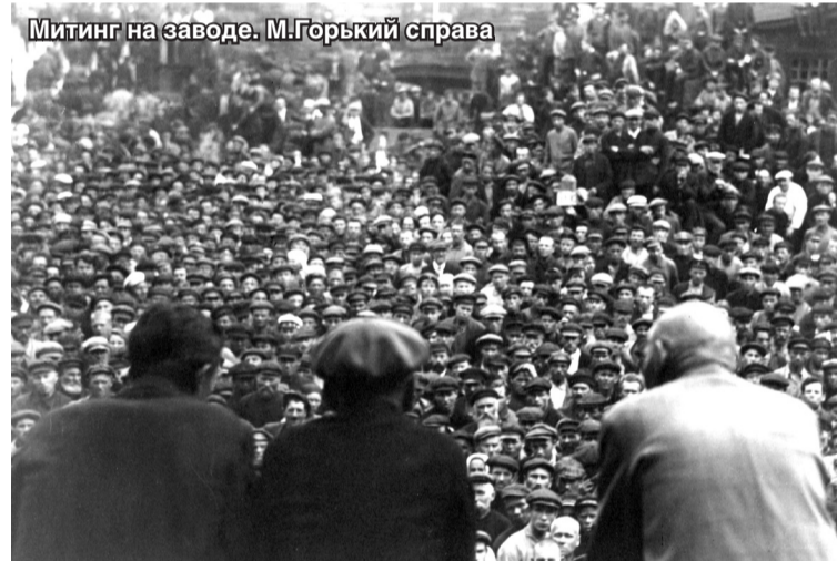
Митинг на заводе. М.Горький справа

Гром рукоплесканий и тысячеголосое «ура» покрыли последние слова оратора.