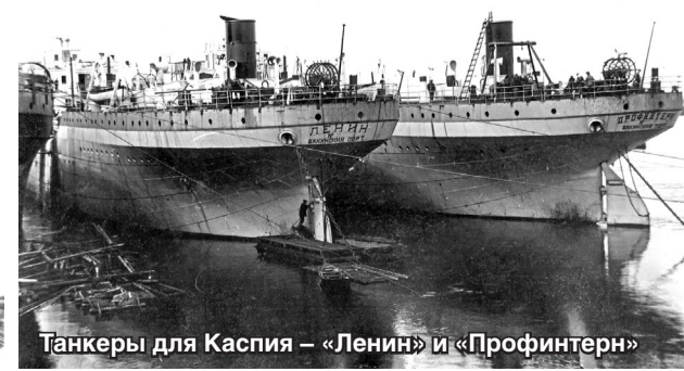
Танкеры для Каспия – «Ленин» и «Профинтерн»

ска. Когда на «Красном Сормове» реализуется несколько инвестиционных программ, в рамках которых внедряются современные технологические разработки? Внедрены механизированные линии изготовления плоских секций, которые позволяют значительно увеличить объём производства и сократить количество сборщиков и сварщиков. Введены в эксплуатацию плазменные резательные машины: это оборудование эффективно и многофункционально – в автоматическом режиме режет металл, делает фаски и разметку. С 2008 года работает линия по очистке металла и его грунтовке. Внедрение этого нового прогрессивного оборудования дает возможность получить замкнутую технологическую цепочку: поставка металла, его дробеструйная очистка, грунтовка, раскрой металла, сборка и сварка