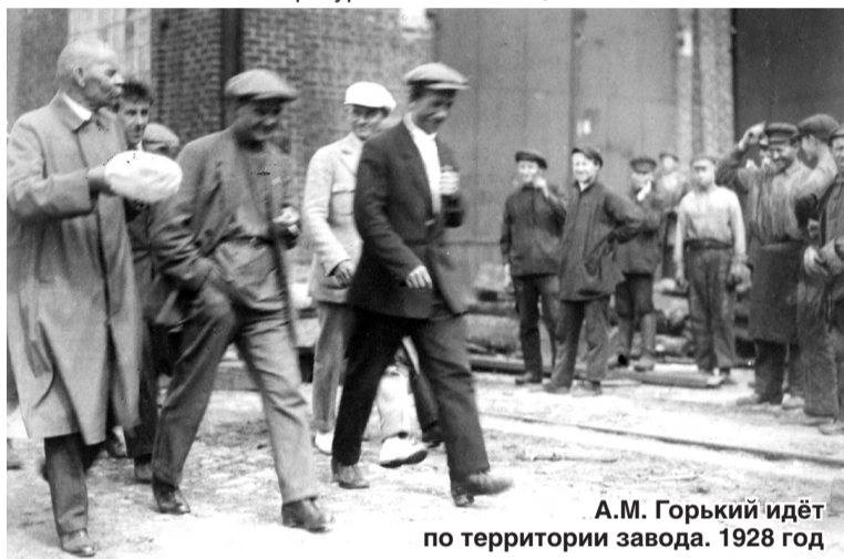
А.М. Горький идёт по территории завода. 1928 год