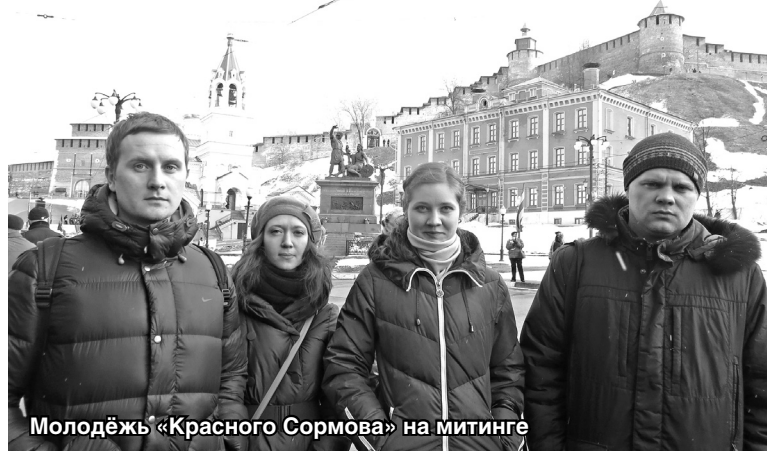
Молодёжь «Красного Сормова» на митинге

Митинги, посвящённые двухлетию присоединения к Российской Федерации республики Крым и города федерального значения Севастополь, прошли во всех крупных городах России.