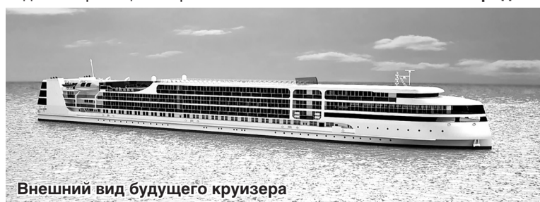
Внешний вид будущего круизера