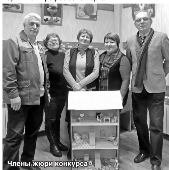
Члены жюри конкурса

Всего в конкурсе приняли участие 42 человека. Победители были награждены Дипломами и денежными премиями. Остальные участники – Дипломами и сладкими призами. Конкурсные работы показали присущие авторам творческое воображение, оригинальность замыслов и мастерство их реализации.