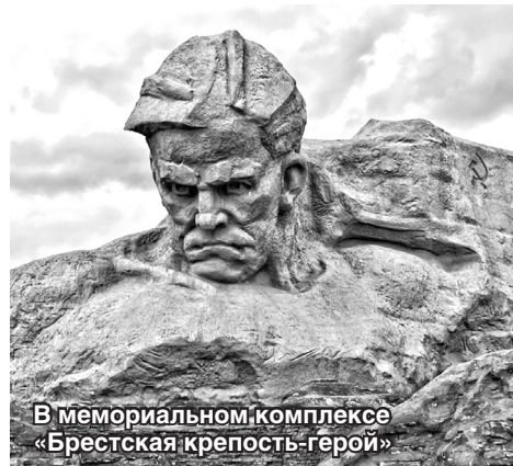
В мемориальном комплексе «Брестская крепость-герой»