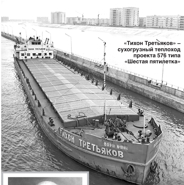
«Тихон Третьяков» – сухогрузный теплоход проекта 576 типа «Шестая пятилетка»