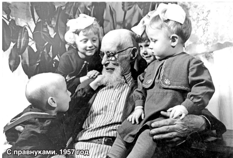
С правнуками. 1957 год