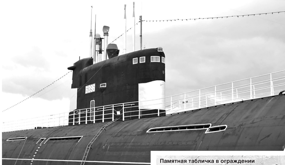
Памятная табличка в ограждении рубки ПЛ Б-396