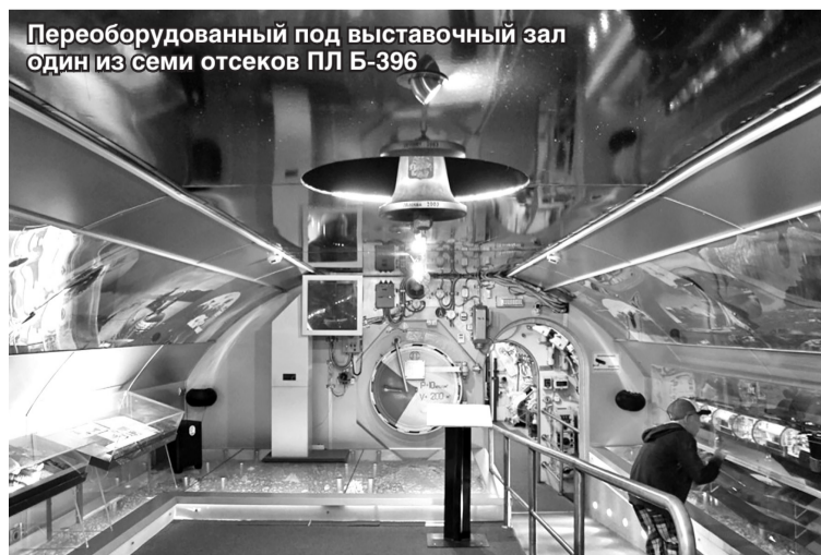
Переоборудованный под выставочный зал один из семи отсеков ПЛ Б-396