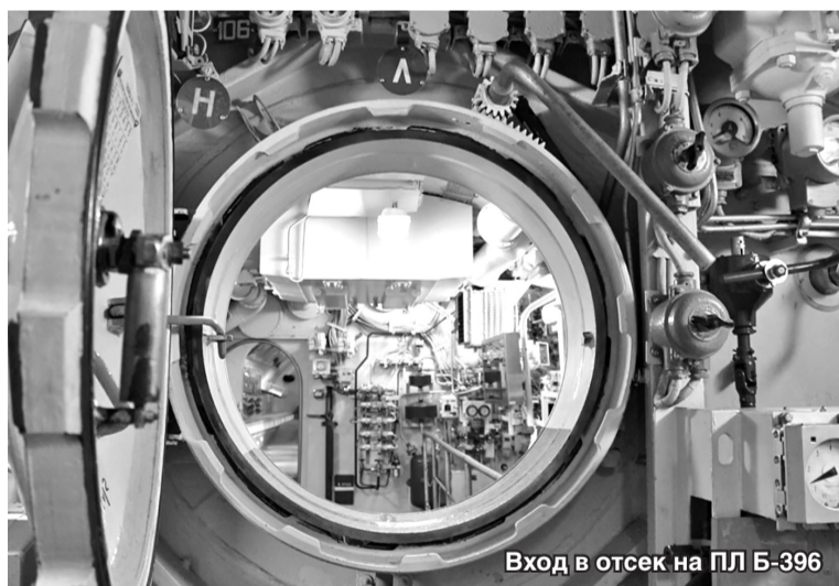
Вход в отсек на ПЛ Б-396

Среди военных моряков лодки проекта 641Б известны под названием «Горьковчанки», на заводе их зовут «Сомами» (по шифру «Сом»), в НАТО они известны как «Танго» – по флагу «Т» из международного свода сигналов, а ещё моряки называют их «резинками» – за специальное шумопоглощающее покрытие корпуса. Это был первый проект трёхвальной подводной лодки, строящейся