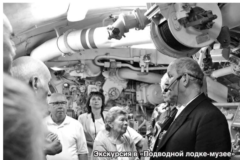
Экскурсия в «Подводной лодке-музее»

Во время Великой Отечественной войны эта «Малютка» совершила 4 военных похода и потопила германский охотник «Uj-1217».