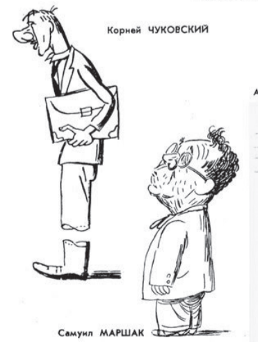
Карикатуры на К. Чуковского и С. Маршак