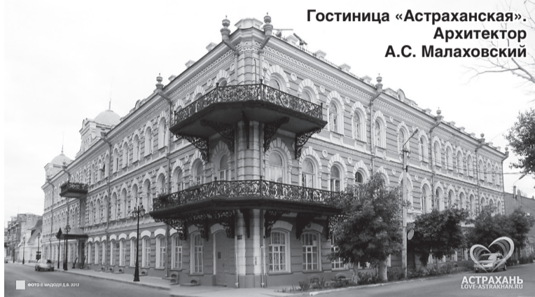
Гостиница «Астраханская». Архитектор А.С. Малаховский

1919 года, 115 лет со дня рождения его сына – Б.Б. Малаховского, известного в 1930-е годы художника, иллюстратора и карикатуриста.