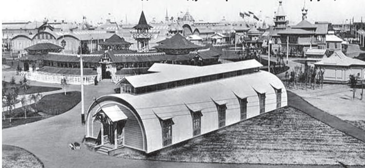
Здание с дугообразными конструкциями

выставки – «Горное дело и металлургия», «Машины, аппараты и электротехника», «Строительство и инженерное дело». Сормовичи демонстрировали продукцию речного и морского судостроения, подвижной состав железных дорог и прочее. Выставка привлекла в заводу внимание и много новых заказчиков, что повлекло заключение новых контрактов. На конец XIX века завод расширил производственные площади, провёл техническую реконструкцию и превратился в крупнейшее предприятие отечественной промышленности.