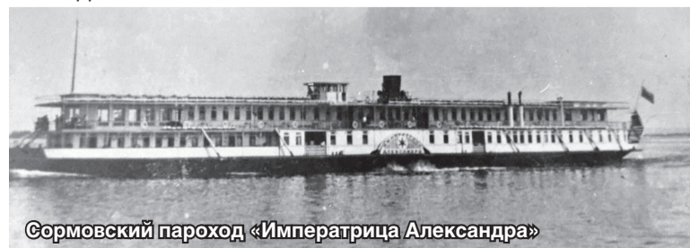
Сормовский пароход «Императрица Александра»

На открытии Выставки каждой фирме-участнице был преподнесён в подарок альбом. Это весьма весомое (в прямом смысле слова) издание – весом около 5 килограммов. На тёмно-зелёном кожаном переплёте золотом вытиснена надпись «Альбом участников