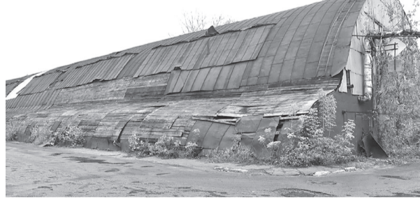
Бывший арматурный цех завода

вился успешно. Сормовский павильон получился светлым, лёгким, воздушным и чем-то напоминал двухпалубный пароход, которые с большим успехом строились на заводе.