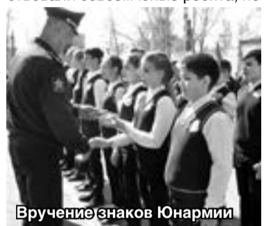
Вручение знаков Юнармии

Потом состоялся осмотр военной техники части, изучение её изнутри методом прощупывания, ознакомление со стрелковым оружием. Рядом присутствовали инструктора части, которые давали грамотные пояснения на все вопросы.