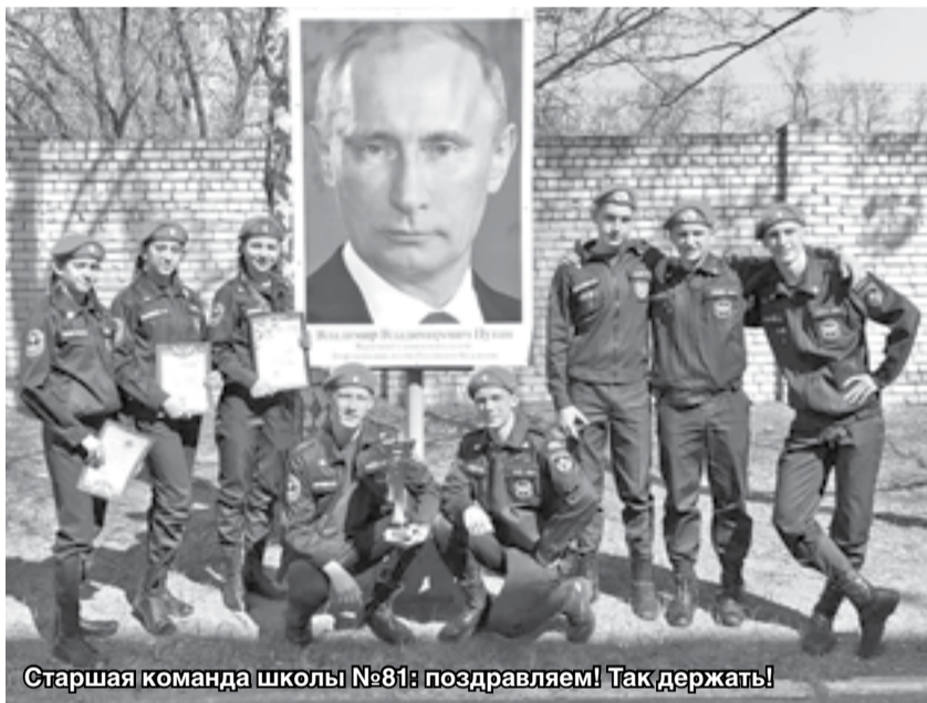
Старшая команда школы №81: поздравляем! Так держать!

Победители получили грамоты и подарки от городского департамента образования. Команды, занявшие первые места в старшей и младшей возрастных группах, примут участие в областных соревнованиях «Нижегородская школа безопасности «Зарница» в мае.