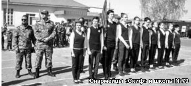
Юнармейцы «Скиф» и школы №79

27 апреля на территории Сормовской военной бригады состоялась патриотическая акция «Областной день призывника» и «Областной день ЮНАРМИИ».