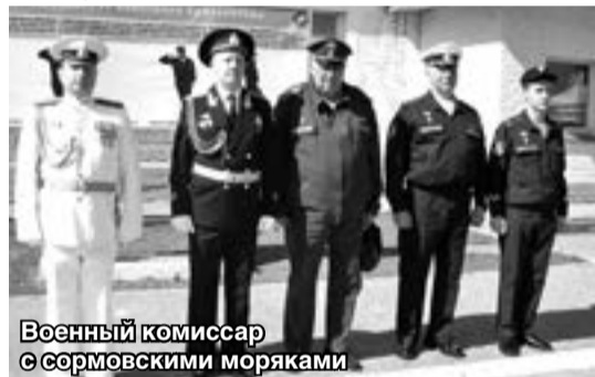
Военный комиссар с сормовскими моряками