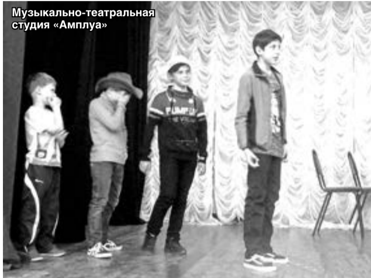
Музыкально-театральная студия «Амплуа»

Вы любите театр и хотите быть в курсе театральной жизни района? Тогда фестиваль «Новые ступени», который открывается на сцене «Буревестника» – для вас! Зрителей ждёт знакомство с театральными коллективами Сормовского и Московского районов, встречи с артистами и режиссёрами и, конечно же, спектакли. Фестиваль «Новые ступени» станет первым этапом районного проекта «Биеннале театрального искусства», посвящённого Году Театра в России. Представим «визитные карточки» сормовских театров читателям «Красного сормовича».