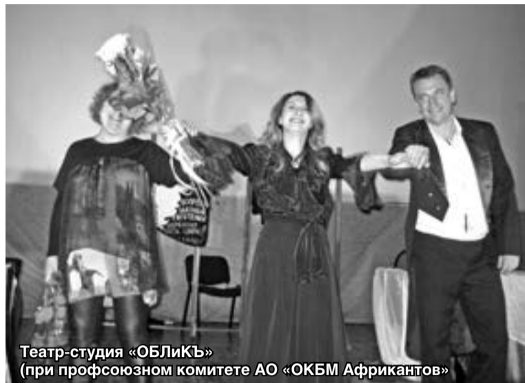
Театр-студия «ОБЛиКЪ» (при профсоюзном комитете АО «ОКБМ Африкантов»)

Театральная мастерская «АХ!» существует уже семь лет