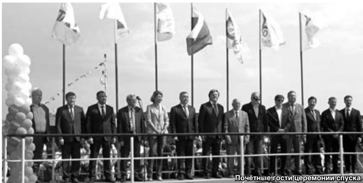
Почётные гости церемонии спуска

вана. И об этом говорит тот факт, что портфель заказов на предприятии сегодня полон, завод работает на полную мощь».