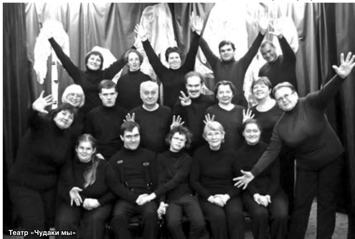
Театр «Чудаки мы»

Завершит майскую биеннале театр-студия «ОБЛиКЪ» (Московский район). В 18.30 зрители увидят спектакль «Сильвия» (режиссёр Л. Серова). Вход свободный.