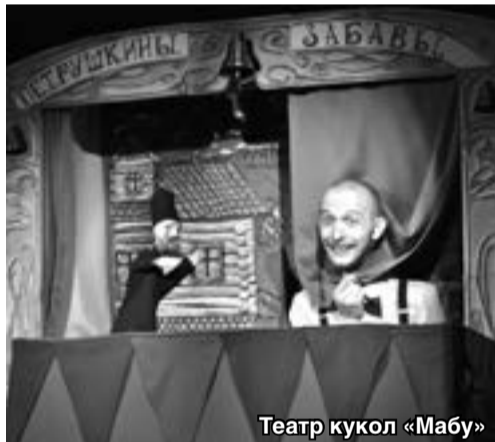
Театр кукол «Мабу»