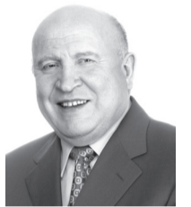
Валерий ШАНЦЕВ, губернатор Нижегородской области

Уверен, что в XXI веке патриотизм наших граждан сделает Россию ещё более могучей, великой и процветающей страной мира! Искренне желаю всем успехов в работе на благо нашей общей Родины!