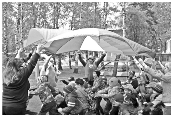
Акция проходила в рамках договора о сотрудничестве между учреждениями.

Детское счастье полновесно тогда, когда ребёнок согрет любовью мам и пап. Но не всем детям это доступно. Поэтому подобные совместные мероприятия очень важны и для малышей, оказавшихся в трудной жизненной ситуации, и для воспитанников детского сада. Дети вместе играли, участвовали в конкурсах и просто искренне радовались происходящему.