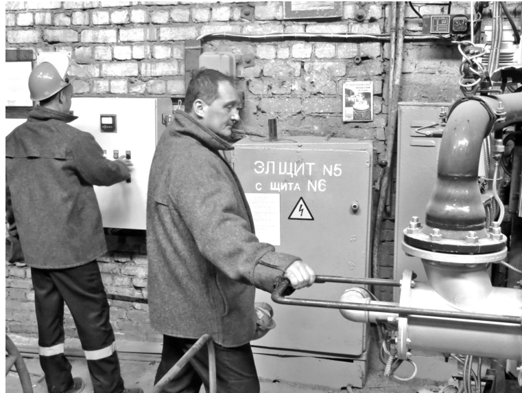
На участке цветного литья идёт подготовка к плавке

В цеху две индукционные печи (на 2,5 т и на 1 т), две газопламенные печи (на 600 кг каждая) и электропечь на 100 кг, которая используется для алюминиевых сплавов. Литейщики также работают с латуной, цинковыми сплавами и бронзой. Основа всего – медь. Латунь получается, если к меди