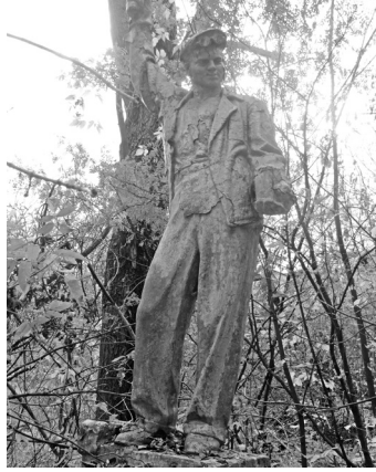
Скульптура металлурга возле бывшего мартеновского цеха

Сормовской металлургии столько же лет, сколько самому заводу. И хотя основным, профильным направлением деятельности завода было судостроение, профессии металлургического производства, наряду с судостроительными, издавна считались самыми почётными на заводе. Кузнецы и литейщики стояли у истоков судостроения. Наряду с мастерскими для верфи в первую очередь были построены кузнечные и литейные мастерские – ведь завод строил металлические суда. Знаковые события в истории сормовской металлургии нашли отражение в памятных знаках на территории завода.