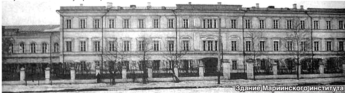
Здание Мариинского института