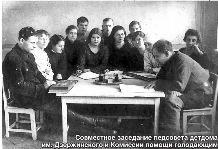
Совместное заседание педсовета детдома им. Дзержинского и Комиссии помощи голодающим

Губком партии принял решение мобилизовать все силы, чтобы не допустить очага восстания в гу-