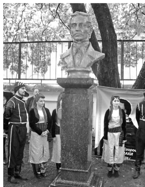
Торжественная церемония открытия памятника Бенардаки в некрополе XIX века Александрово-Невской лавры. 2011 год

В последнее время интерес туристов и жителей Нижнего Новгорода к Сормову и другим окраинным рабочим районам города растёт. Спрос рождает предложение – потому и плодятся так называемые «чёрные» или «серые» экскурсоводы, самонадеянные и не всегда добросовестные. Легковёрным доверчивым экскурсантам они поведают немало былей пополам с небылицами. Сотрудники музея оперируют только истинными, проверенными фактами. Не менее интересно. И бесплатно.