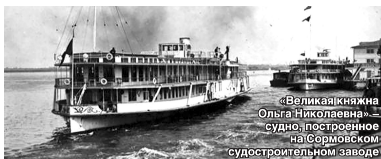
«Великая княжна Ольга Николаевна» – судно, построенное на Сормовском судостроительном заводе