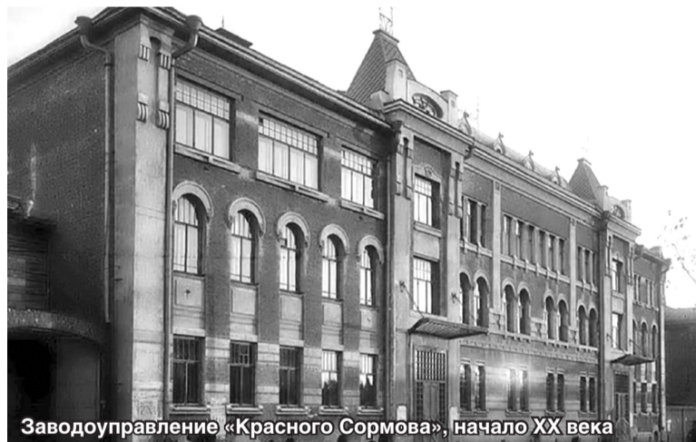
Заводуправление «Красного Сормова», начало XX века