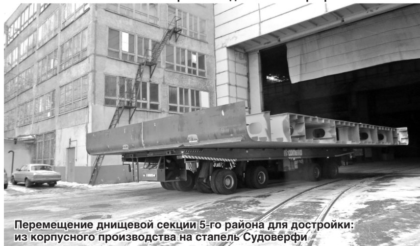
Перемещение днищевой секции 5-го района для достройки: из корпусного производства на стапель Судоверфи

Материалы подготовила Маргарита ФИНЮКОВА