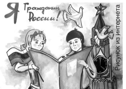
Рисунок из интернета