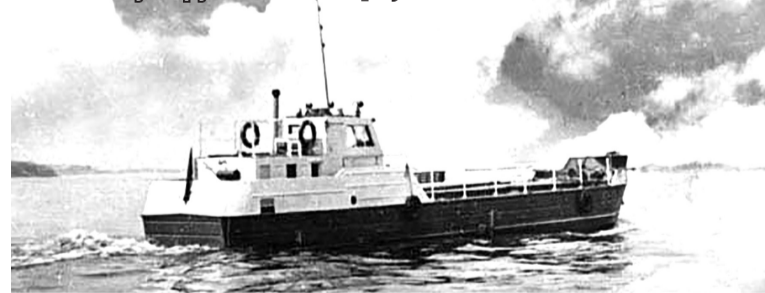
Речной сухогруз «Колхозница», 1955 г.

грузоподъёмностью 1700 тонн и буксирный пароход мощностью 150 л.с.