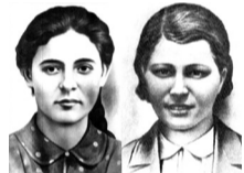
В 1949 году буксирные теплоходы получили имена Ульяны Громовой и Любови Шевцовой