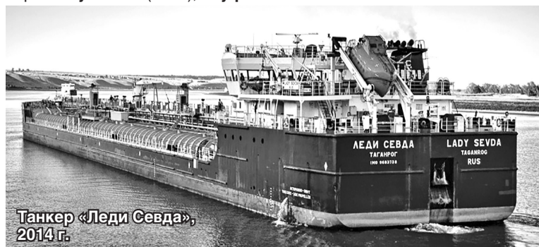
Танкер «Леди Севда», 2014 г.

Материалы подготовила Маргарита ФИНЮКОВА