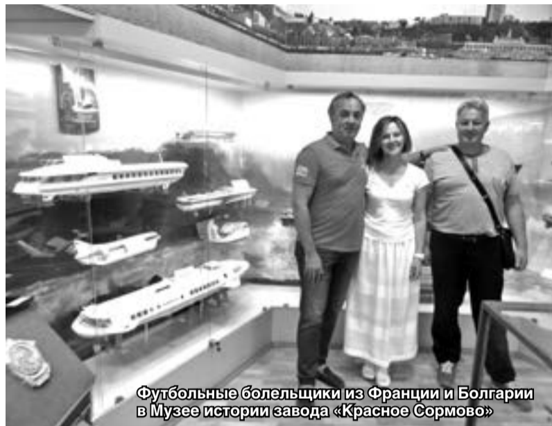
Футбольные болельщики из Франции и Болгарии в Музее истории завода «Красное Сормово»

Только за первый летний месяц и две недели июля Музей истории завода «Красное Сормово» посетили более 600