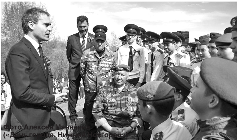
Фото Алексей Мясной («День города, Нижний Новгород»)

В Нижнем Новгороде отметили 73-ю годовщину победы в Великой Отечественной войне. В этот солнечный день тысячи горожан вышли на улицы, чтобы принять участие в митингах и шествиях; многие целыми семьями отправились на площадь Минина посмотреть парад, посетить кино, послушать концерт, а то и посмотреть историческую реконструкцию в Парке Победы.