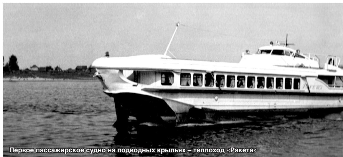
Первое пассажирское судно на подводных крыльях – теплоход «Ракета»

Календарь памятных дат подготовлен сотрудниками музея истории завода «Красное Сормово»