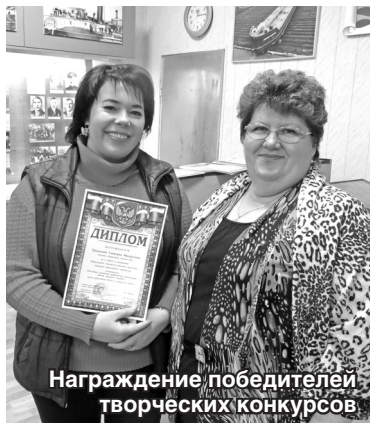
Награждение победителей творческих конкурсов

За 11 месяцев 2017 года на средства из прибыли Общества приобретены санаторно-курортные путёвки на общую сумму 467 978 руб. и выделены 16 работникам за 30% от общей стоимости путёвок. На протяжении нескольких лет действует программа Облсвопрофа по льготному оздоровлению членов профсоюза и членов их семей в санаториях Нижегородской области «Зелёный город», «Городецкий» и имени ВЦСПС. В 2017 году путёвки льготного оздоровления с 15-процентной скидкой от базовой стоимости приобрели 4 человека , в том числе члены их семей.