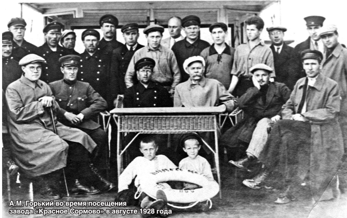
А.М. Горький во время посещения завода «Красное Сормово» в августе 1928 года