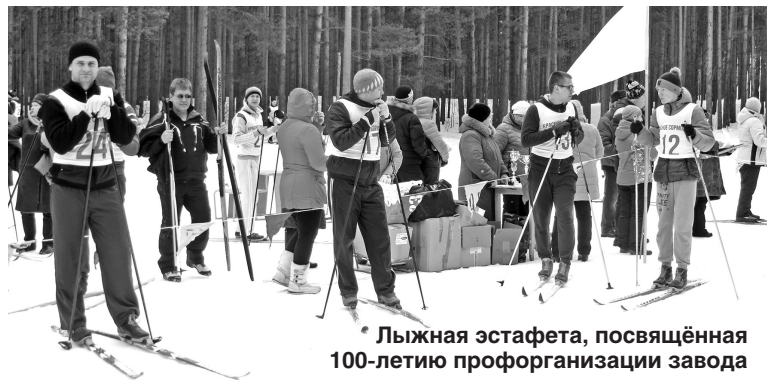
Лыжная эстафета, посвящённая 100-летию профорганизации завода

На срок полномочий профсоюзного комитета избрана контрольно-ревизионная комиссия. Члены комиссии контролируют правильность расходования средств профсоюзного бюджета, своевременность предоставления отчётности, правильность выдачи материальной помощи членам профсоюза в цеховых, участковых комитетах и профбюро, проводят проверки по соблюдению установленного порядка учёта членов профсоюза и информируют профком о результатах ревизий. Контрольно-ревизионная комиссия ежегодно отчитывается о проделанной работе перед членами профсоюза.