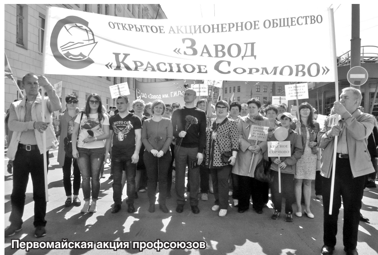
Первомайская акция профсоюзов

Согласно п.7.9. колдоговора и личным заявлениям работников предприятие оказало материальную помощь на сумму