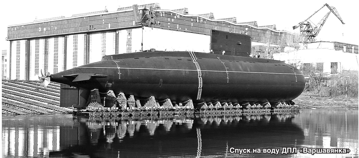
Спуск на воду ДПЛ «Варшавянка»