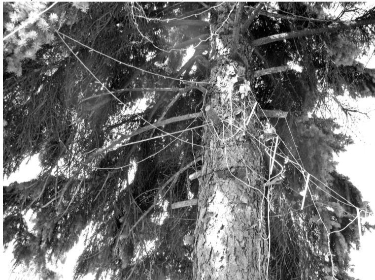
Ель-памятник в «паутине» проводов