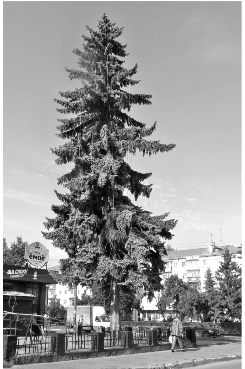
Самой первой в Сормове голубой ели три четверти века

Неудивительно, что сормовички близко к сердцу приняли судьбу голубой ели: для них война – не