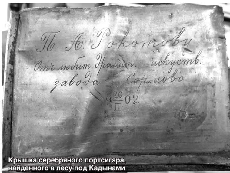
Крышка серебряного портсигара, найденного в лесу под Кадынами

В разделе своих воспоминаний «Первый революционный штаб в Сормове – рабочая столовая» Боков пишет: «В Сормове, где в настоящее время стоит пятиэтажный дом на улице Ефремова, шестьдесят лет тому назад (в 1905 году – прим. авт.) стояла рабочая столовая. Это было длинное, ме-