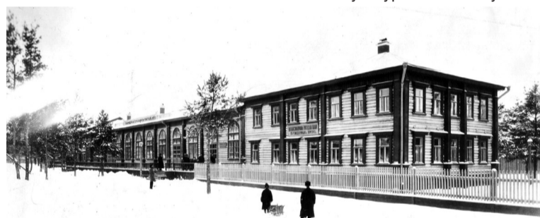
Народная столовая в Сормове

Любопытнейшая историческая находка совершила путешествие по маршруту Кадыны (Польша) – Сормово (Россия) благодаря