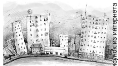
Рисунок из интернета

В Нижнем Новгороде стартует конкурс «Лучший совет многоквартирного дома».