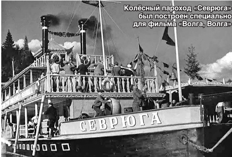
Колёсный пароход «Северяга» был построен специально для фильма «Волга, Волга»

и «Вячеслав Молотов») и 12 пассажирских катеров, получивших имена первых Героев Советского Союза: «Каманин», «Леваневский», «Молоков», «Ляпидевский», «Доронин», «Слепнёв», «Громов», «Чкалов», «Байдуков», «Беляков», «Водопьянов», «Коккинаки».