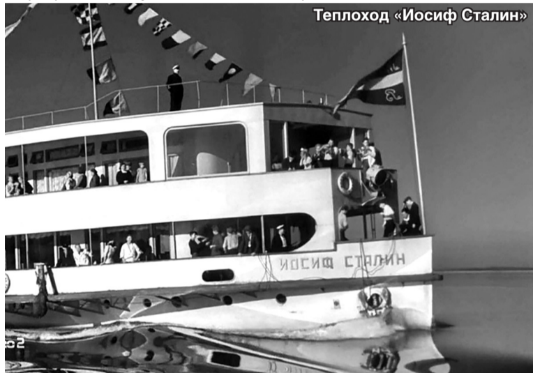
Теплоход «Иосиф Сталин»

О дальнейшей судьбе теплохода поступают противоречивые сообщения. Так, 6 сентября «НТА-Приволжье» проинформировало о том, что «яхта Сталина» будет пришвартована в Нижнем Новгороде и превращена в музей.