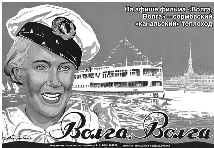
На афише фильма «Волга, Волга» – сормовский «канальский» теплоход

В апреле 1937 года были спущены на воду и отправлены на канал четыре товаро-пассажирских теплохода («Иосиф Сталин», «Клим Ворошилов», «Михаил Калинин»