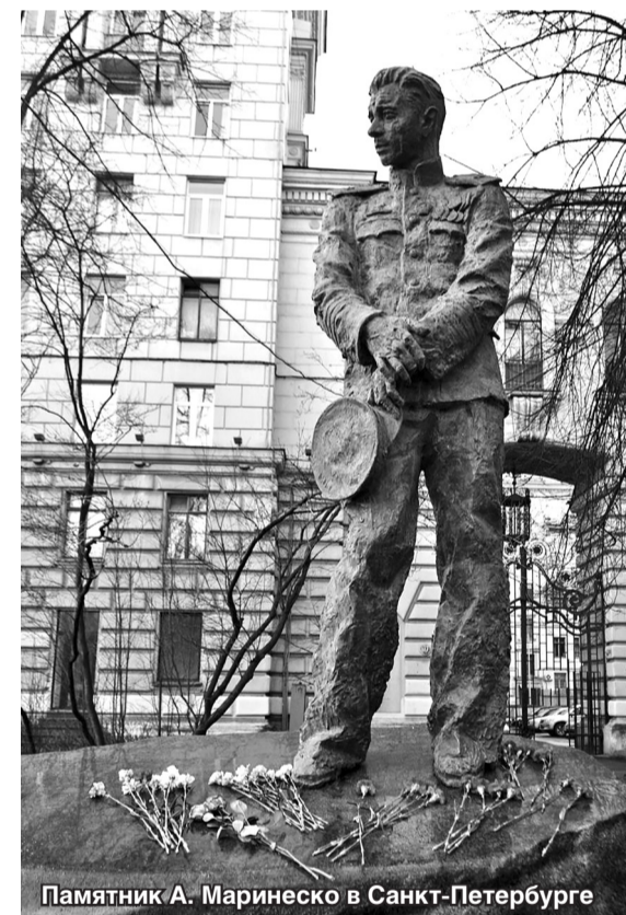
Памятник А. Маринеско в Санкт-Петербурге

Наши лодки стали музеями и за рубежом: в швед-