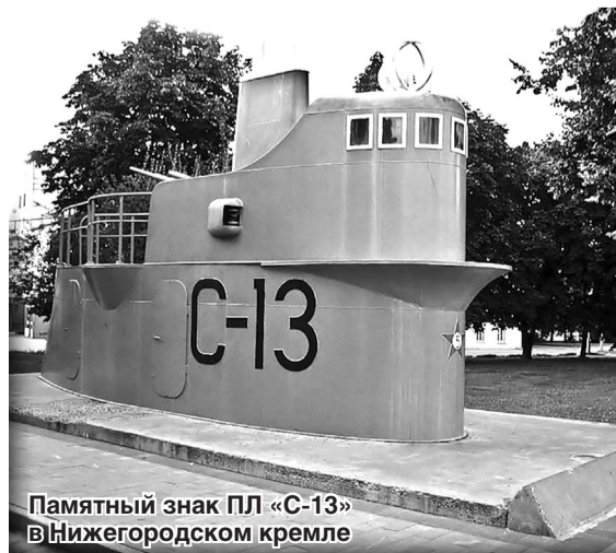
Памятный знак ПЛ «С-13» в Нижегородском кремле

Памятники командиру сормовской подводной лодки установлены в Калининграде, в Кронштадте и в Санкт-Петербурге. Макет ограждения рубки «С-13» установлен в Нижегородском кремле, в память о ратных подвигах моряков-подводников и трудовом подвиге сормовских кораблестроителей в годы Великой Отечественной войны.