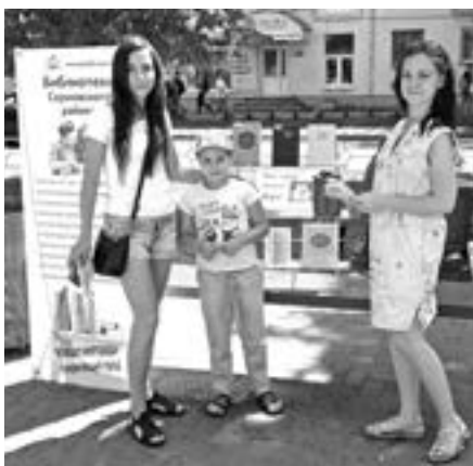
Всем участникам конкурсов были вручены призы-сувениры и буклет «Театральный Нижний».

Все желающие активно отвечали на вопросы познавательной викторины, а также фотографировались, используя театральную атрибутику.