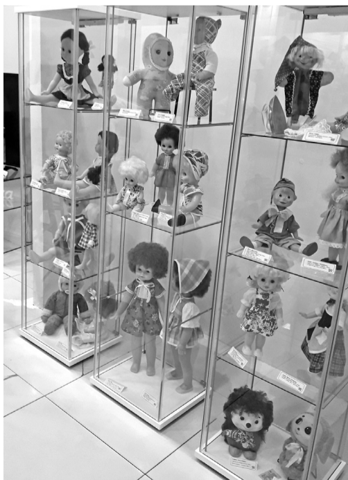
густа ежедневно с 11.00 до 18.00. Вход свободный.