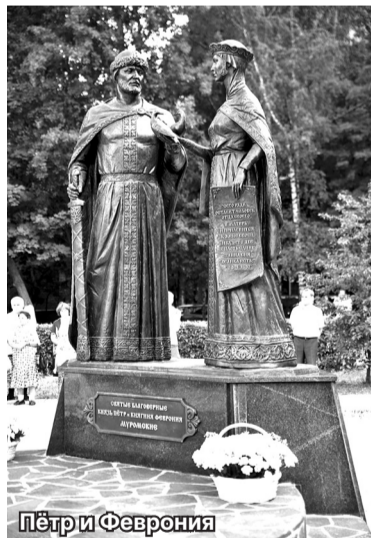
Пётр и Феврония