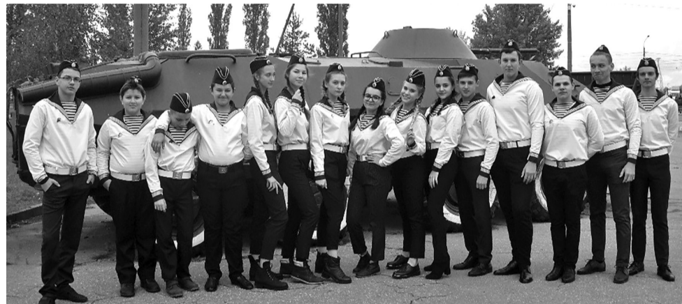
Материалы полосы подготовил Михаил КАСТОРСКИЙ