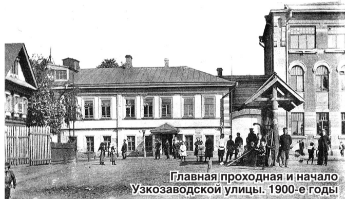
Главная проходная и начало Узкозаводской улицы. 1900-е годы

Сегодня история территории возле главной проходной завода получила новое развитие. Нет сомнений, что новый сквер станет одним из примечательных уголков Сормова, любимым местом отдыха заводчан.