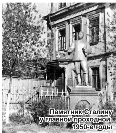
Памятник Сталину у главной проходной. 1950-е годы