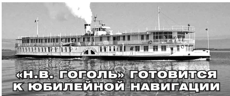
«Н.В. ГОГОЛЬ» ГОТОВИТСЯ К ЮБИЛЕЙНОЙ НАВИГАЦИИ

Сегодня водные пути России бороздят теплоходы, турбоходы, электроходы и атомоходы. Единственным в нашей стране колёсным пароходом, находящимся в регулярной эксплуатации, является пароход «Н.В. Гоголь», принадлежащий АО «ЦС Звёздочка» и курсирующий по Северной Двине. Пароход построен на Сормовской верфи, в 2021 году он отметит свой 110-летний юбилей.