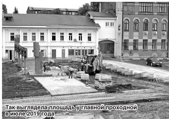
Так выглядела площадь у главной проходной в июле 2019 года

С начала лета сормовичи и работники завода могли видеть, как меняется участок у заводской проходной. К началу осени территория преобразилась: площадка выровнена, убраны ветхие деревья и деревья малоценных пород, организованы пешеходные дорожки,