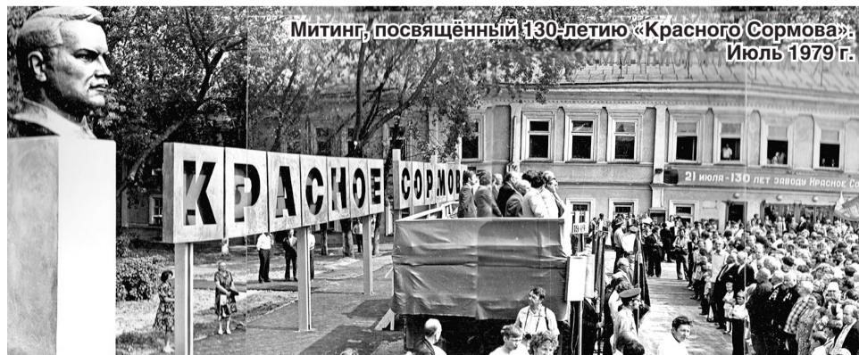
Митинг, посвящённый 130-летию «Красного Сормова». Июль 1979 г.

Материалы подготовила Маргарита ФИНЮКОВА