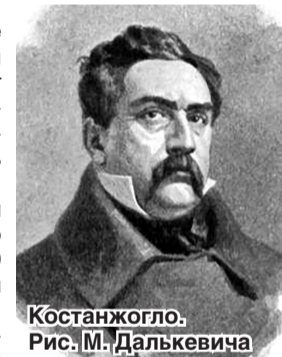
Костанжогло.